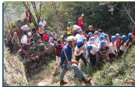
Foto di gruppo.