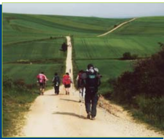
Le Miestas - la strada è lunga, ma non ci scoraggia.

Ormai ce l'avevamo fatta con serenità, gioia e un po' di rimorsi per quello che avevamo lasciato in Italia. Alle 5-20 la partenza: il tragitto era di nuovo un saliscendi fra boschi di eucalipti giganteschi. Finalmente troviamo il cippo di pietra che reca scolpiti una