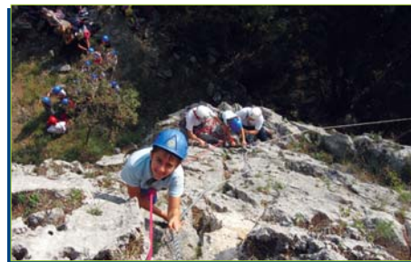
Ragazzi impegnati nella salita.