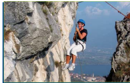
Anche le maestre giocano.